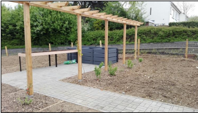
Aanleg van Buurttuin Rodenemhof (advies 01-17)