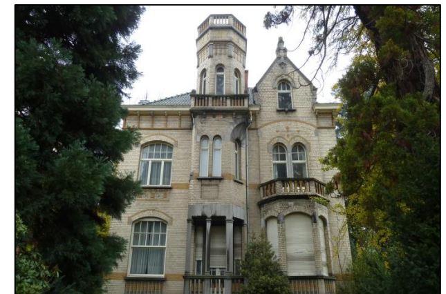
Intensieve verdichtingsbouw aan Bergensesteenweg (advies 11-17)