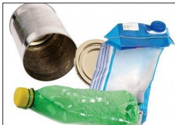
Meer soorten plastics in PMD zak (advies 08-17)