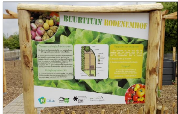
Gebruiksovereenkomst Buurttuin Rodenemhof (advies 04-17)