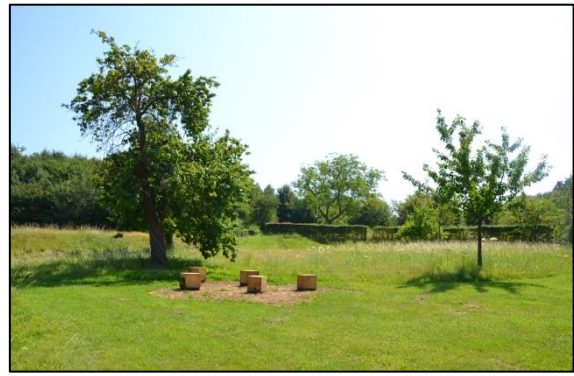
Educatieve uitwerking Warandepark (advies 02-17)