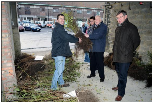
Plantactie Natuurlijk Halle (advies 09-17)