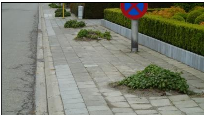
Vervanging van gerooide laanbomen (advies 03-17)