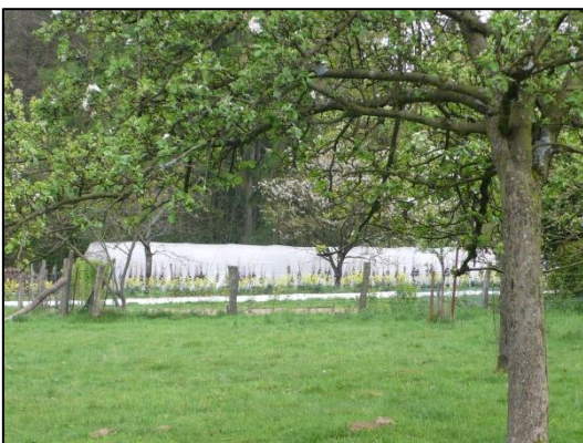
Intensieve tuinbouw in kwetsbare bosrand en in landschappelijk waardevol gebied (advies 05-17)