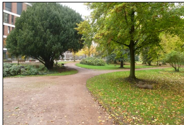
Betonnen wandelpaden in Albertpark? (advies 10-17)