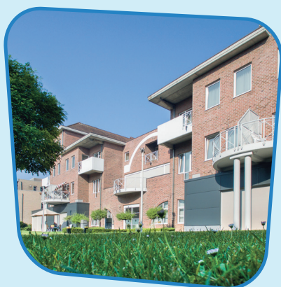
Centrum Van Koekenbeek Auguste Demaeghtlaan 28 1500 Halle