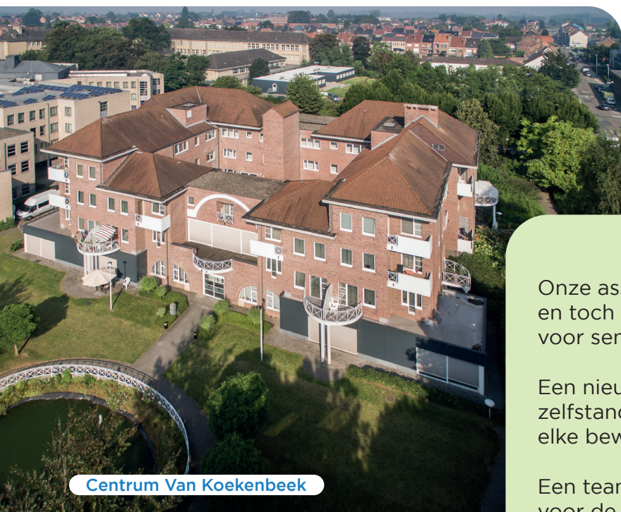
Centrum Van Koekenbeek