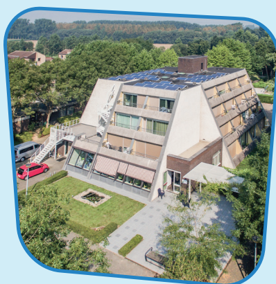
Ten Hove Koppeiweg 14 1500 Halle