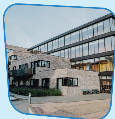
Residentie Huiskensveld Jean Jacminstraat 5 1500 Halle